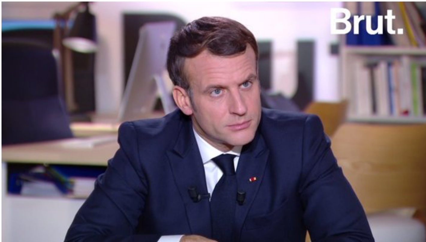
L'actuel président de la République française Emmanuel Macron s'exprimant sur Brut Der derzeitige französische Staatspräsident Emmanuel Macron spricht auf Brut