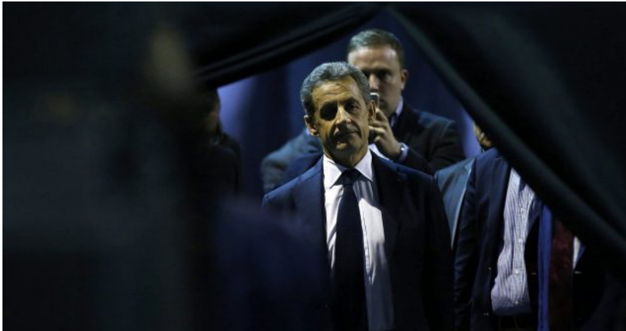
L'ancien président de la République française Nicolas Sarkozy Der frühere französische Staatspräsident Nicolas Sarkozy